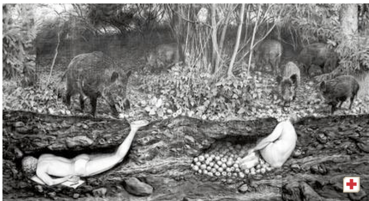
Eine surreale Waldwelt zeigt Olrik Kohlhoff.

21. Juli 2012 | 00:00 Uhr | Von KARIN LUBOWSKI